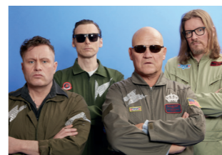
Sonntag, 18.30 Uhr Die Rockys Die Kultband aus Dresden