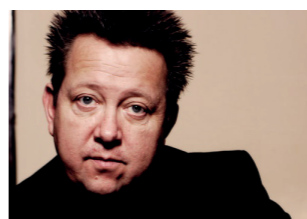
Montag, 14.30 Uhr Sebastian Krumbiegel (Die Prinzen) Live am Piano