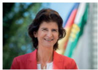
Dr. Eva Maria Stange Staatsministerin für Wissenschaft und Kunst