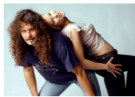
Take It Naked