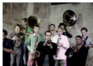
Samstag, 15.45 Uhr Banda Comunale Harte Töne für Blechblasinstrumente: international, multikulturell, höllenschnell!